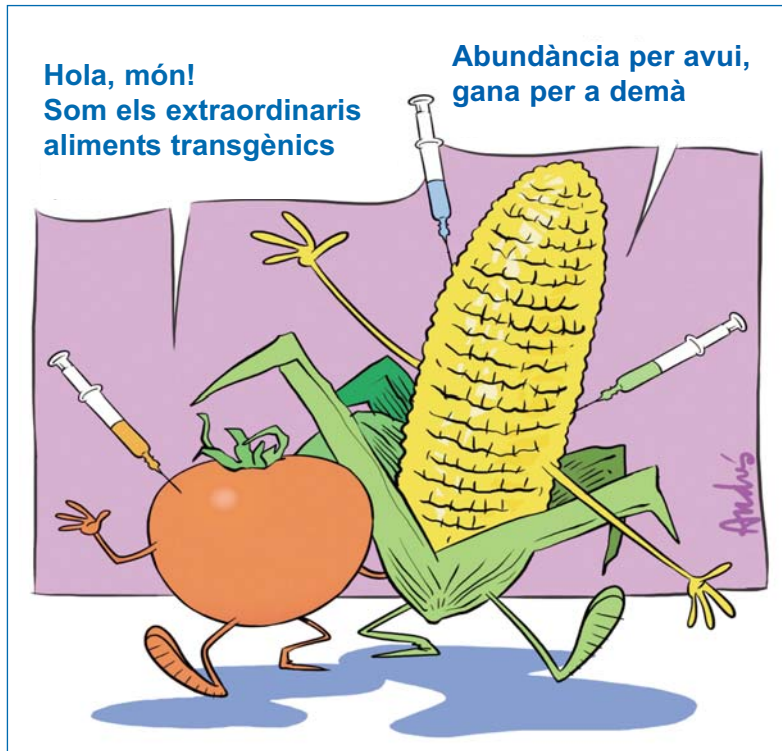
La vinyeta: Andrés

Subscripció anual de la revista: 6 euros